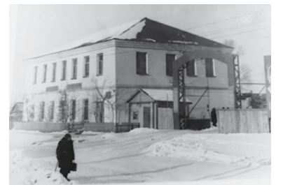
Болотнинский гофротарный завод на ул. Комитетская, начало 1970-х гг.