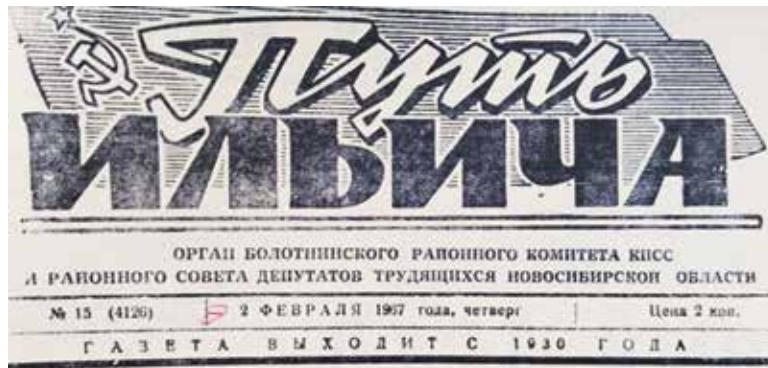
Заметка «Новая фабрика» в газете «Путь Ильича» в номере от 2 февраля 1967 г. о будущем строительстве фабрики картонных ящиков в Болотном на ул. Московская.

«В этом году в нашем городе развернется строительство фабрики картонных ящиков. Главный корпус ее протянется вдоль Московской улицы от элеватора до Сенного